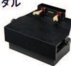
吉澤 ピアノ補助台 AX-SZ又は同等品

高さ ①14cm ④21.5cm ②17.5cm ⑤23.5cm ③20cm ⑥24.5cm