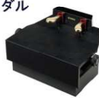
吉澤 ピアノ補助台 AX-SZ又は同等品

高さ ①14cm ④21.5cm ②17.5cm ⑤23.5cm ③20cm ⑥24.5cm